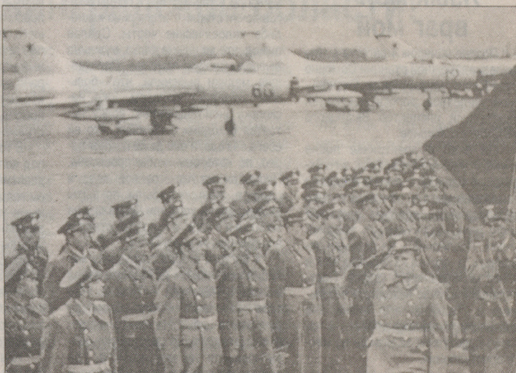
На фото: Сиверский авиаполк в 1973-м году (справа) и сейчас (слева). Об истории российского воздухоплавания читайте на 2-й стр.